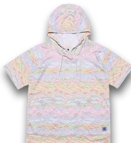
UVカットブルパーカー・オーシャン [ カラフル魚群 ]

トップスは上下方向から開閉可能なジップアップタイプの長袖 UV カットパーカーと、T シャツ感覚で着脱できる半袖 UV カットブルパーカーの2タイプ。爽やかで涼しげな水中の泡と魚をイメージした柄と、2色の魚群イメージ柄の3つから選べます。