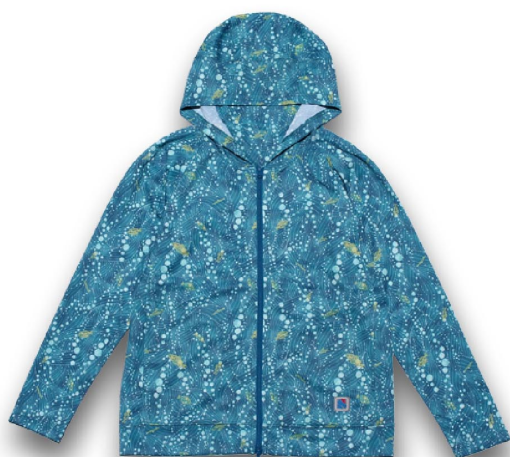
UVカットパーカー・オーシャン [ 泡 ]

女性のための、おしゃれで快適なフィッシングウェアブランド「Shipsmast」から、夏も快適にアウトドアを楽しめるウェア『オーシャンシリーズ』が新登場しました。